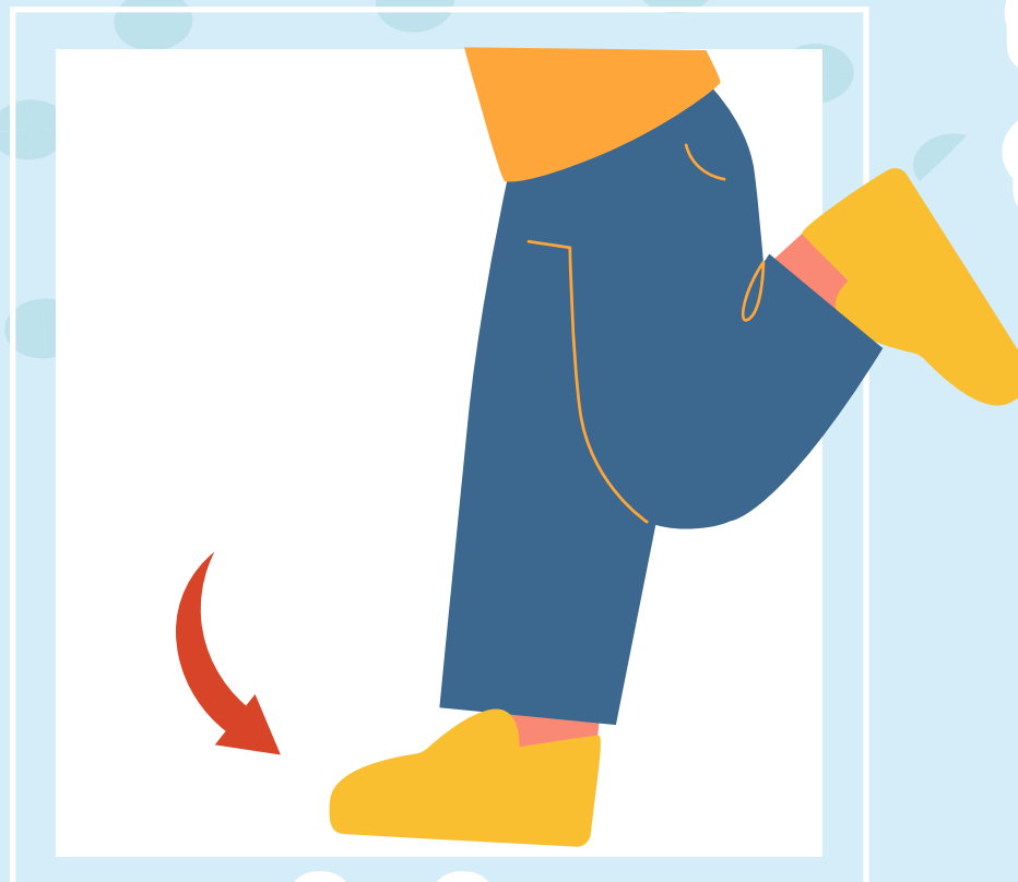
สวมรองเท้าทำงานที่กันลื่นและพอดีกับเท้า